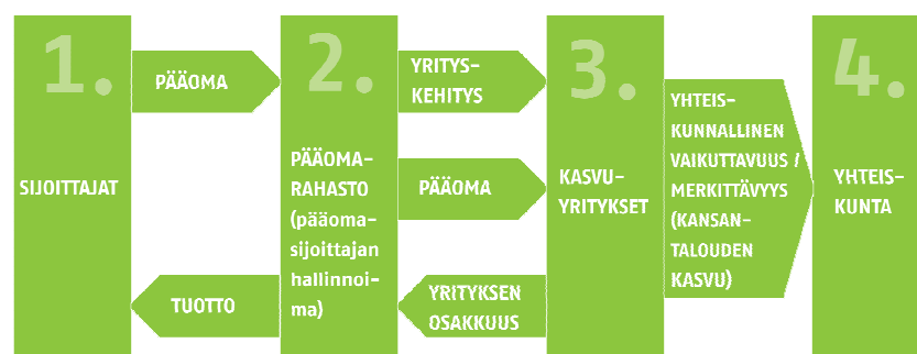
Kuva 1. Pääomasijoitustoimialan toimintamalli

Pääomasijoitustoimialan toimintamalli voidaan esittää kuvan 1 osoittamalla tavalla. Ensimmäinen vaihe käsittää varojenkeruun ( fundraising ), jolloin Pääomasijoittajan perustamaan Pääomasijoitusrahastoon kerätään varat sijoittamista varten. Tyypillisimpinä sijoittajatahoina toimivat institutionaaliset sijoittajat, kuten eläkelaitokset ja vakuutusyhtiöt. Varojen keräämisen jälkeen Pääomasijoittajat ryhtyvät etsimään kehityskelpoisia sijoituskohteita, joihin Pääomasijoitusrahastoihin kerättyä sijoitusvarallisuutta sijoitetaan. Pääoman ohella Pääomasijoittajat osallistuvat aktiivisesti kohdeyrityksen kehittämiseen muun muassa toimimalla yrityksen hallituksessa. Pääomasijoittajien tuotto syntyy Kohdeyrityksen kehittämisestä ja kasvattamisesta syntyvästä Kohdeyrityksen arvonnoususta, joka realisoidaan myytessä Kohdeyritys. Myynnistä saatavat varat, sijoitukseen sitoutunut pääoma ja saavutettu tuotto, maksetaan Pääomasijoitusrahaston sijoittajille. Sijoittajien saaman tuoton ohella Pääomasijoittajat tekevät tärkeitä työtä myös kansantaloudelle. Kohdeyritysten aktiivinen kehittämistyö ja liiketoiminnan kasvattaminen näkyvät välillisesti verotulojen kasvussa ja työllisyyden kohenemisessa, kehittäen näin koko yhteiskuntaa.